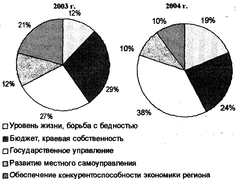
Рис. 1. Тематика правовых актов, принятых в 2003-2004 гг.

Вместе с тем на формировании повестки дня сессий краевого Совета не могли не сказаться тенденции в социально-экономическом развитии края, инициативы и нововведения со стороны Президента Российской Федерации В.В.Путина и Государственной Думы Федерального Собрания Российской Федерации (далее – Государственная Дума).